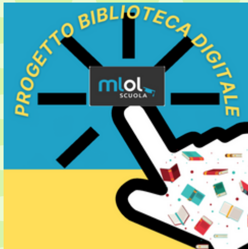
Digital lending, Information Literacy