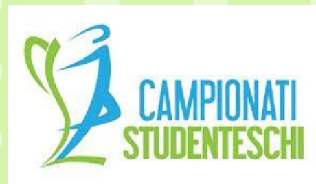
Progetto per la scuola secondaria di primo grado