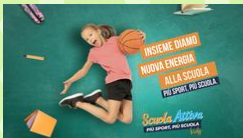
Capacità e schemi motori di base, primo orientamento allo sport, la cultura del benessere e del movimento