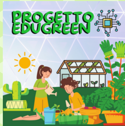
Orti e giardini didattici