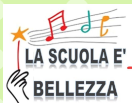
Progetto di Educazione Civica