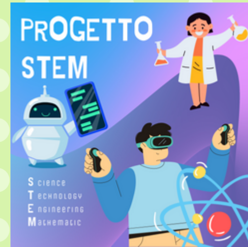
Science, Technology, Engineering e Mathematics